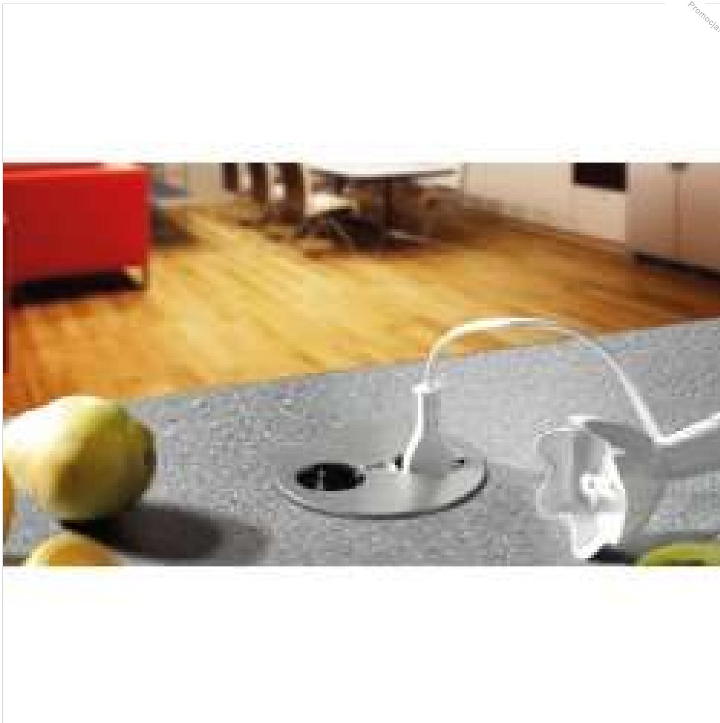
Bachmann Twist - Gniazdko blatowe kuchenne