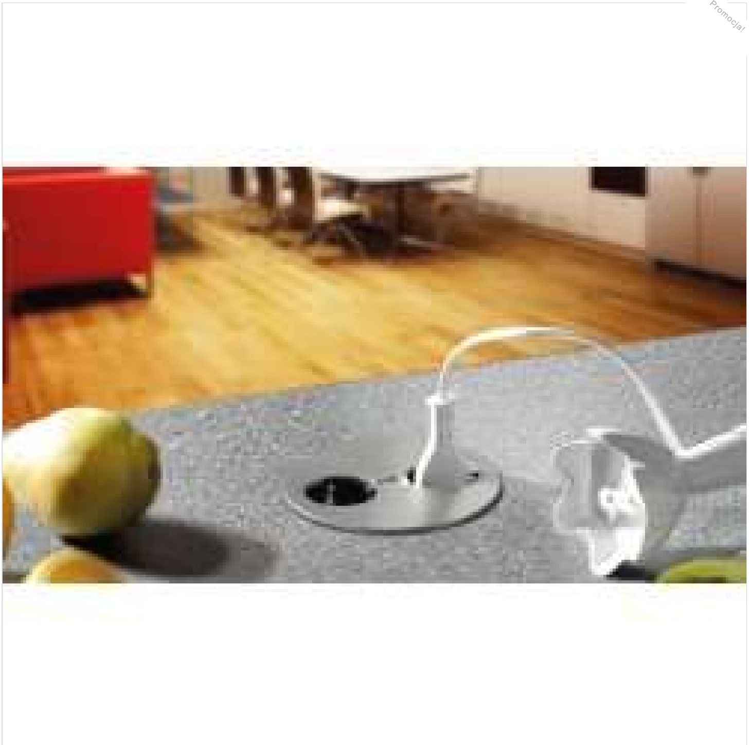
Bachmann Twist - Gniazdko blatowe kuchenne