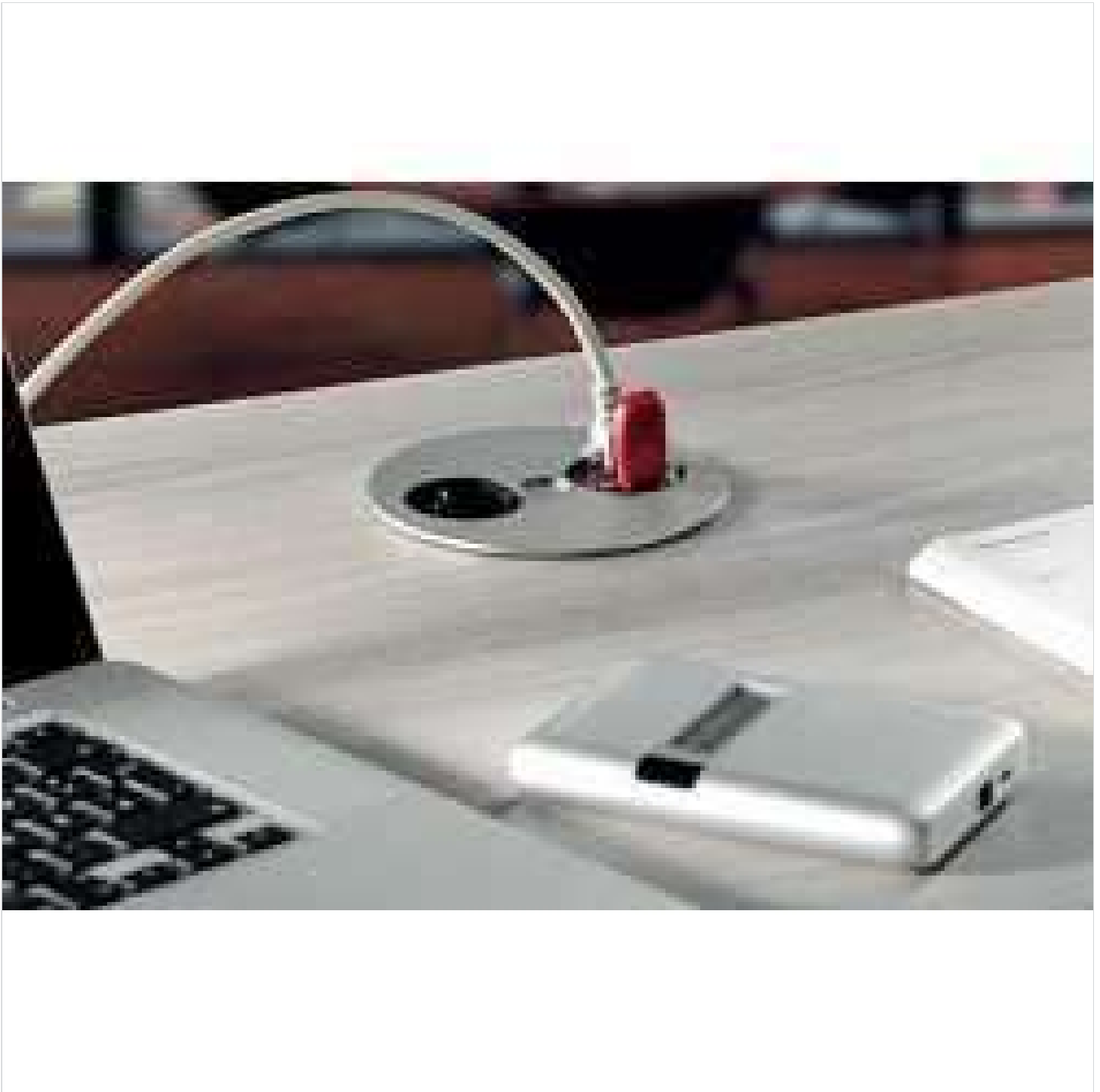
Bachmann Twist Data - Gniazdko blatowe