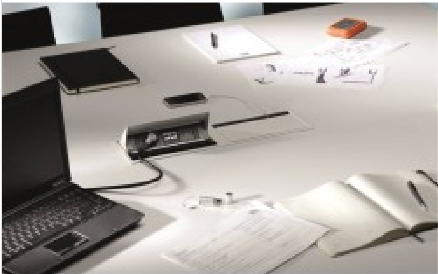
Bachmann Coni Duo biały - Mediaport do sali konferencyjnej